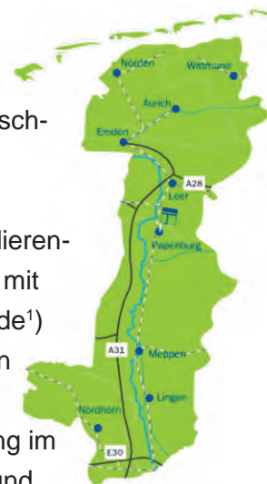
Abb. 1 Region „Ems-Achse“

Die Hochschule Emden/Leer wurde 1973 gegründet und ist mit ca. 4.700 Studierenden und 109 ProfessorInnen eine der kleineren Hochschulen Niedersachsens mit den Fachbereichen Technik (2.200 Studierende 1 ), Wirtschaft (1.000 Studierende 1 ) sowie Soziale Arbeit und Gesundheit (1.100 Studierende 1 ) am Standort Emden und dem Fachbereich Seefahrt (400 Studierende 1 ) in Leer. Die drei zentralen Forschungsschwerpunkte „Nachhaltige Technologien“, „Ressourcenorientierung im Spannungsfeld von Individuum und Gesellschaft“ und „Industrielle Informatik und Automatisierungssysteme“ wurden 2013 definiert und in die Forschungslandkarte der HRK aufgenommen [1].